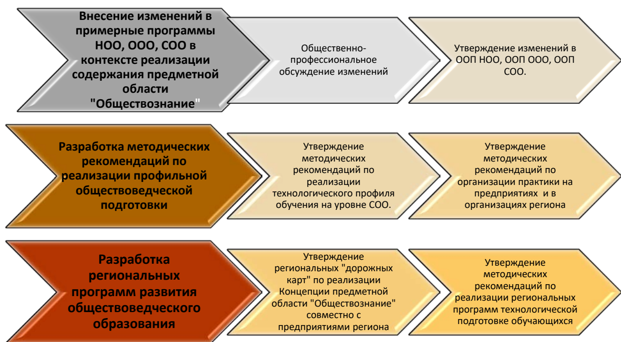
Рис. Организационная схема процесса нормативно-правового и научно-методического обеспечения реализации концепции предметной области «Обществознание»

Материально-техническое обеспечение и требования к учебному и лабораторно-технологическому оборудованию, инструментам в предметной области «Обществознание» представлены в разделе «Инструментарий и средства материально-технического обеспечения»